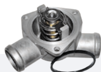
■ 21082-1306020 «Ремкомплект термостата 21082-1306010-14»